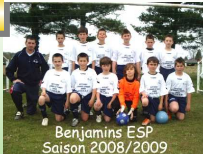
Les benjamins ont reçu un jeu de maillots offerts par la Cabane à Poulets

Chez les grands, les vétérans ont fait un championnat où ils ont alterné le bon et le catastrophique. Ils se sont écroulés contre le leader mais ont réussi quelques bons coups contre des équipes supérieures sur le papier. Au final, ils laissent 2 équipes derrière eux au classement. Les seniors à 7 de Biron avaient un groupe homogène. Les résultats ont été au rendez vous puisqu'ils terminent premier de leur poule