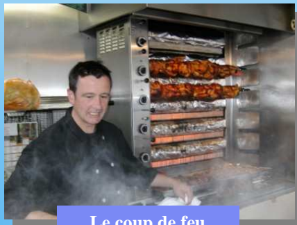
Le coup de feu

Un désir de vouloir gérer leur temps, de trouver un équilibre avec la vie familiale et la lecture d'une annonce de location d'une remorque de rôtisserie les décide à tenter l'aventure des marchés et vendre des poulets rôtis.