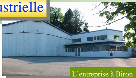
L'entreprise à Biron