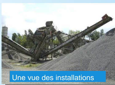
Une vue des installations

R- De 1980 à 1985, nous avons cherché d'autres gisements, effectué de nombreux sondages et dragué le Gave, jusqu'à expiration de l'autorisa-