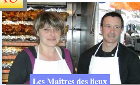
Les Maîtres des lieux

Au bout d'un an de course folle, le pari est gagné : ça marche et ça leur plait : ils investissent dans une belle remorque aménagée en rôtisserie, jusqu'à 200 poulets par marché !!!!!. Actuellement ils sont présents sur les marchés d'Orthez (2 fois par semaine), de Peyrehorade et de Billère avec des marchés ponctuels selon les saisons et programmes et se sont diversifiés en ajoutant à leur carte : cochon de lait, caille et longe de porc.. Ils proposent aussi pour des manifes-